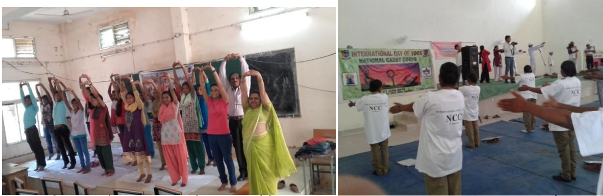
अंतर्राष्टिय योग दिवस पर योगाभ्यास, कैंडेट, एन.सी.सी. अधिकारी एवं स्टाफ द्वारा सामूहिक योग