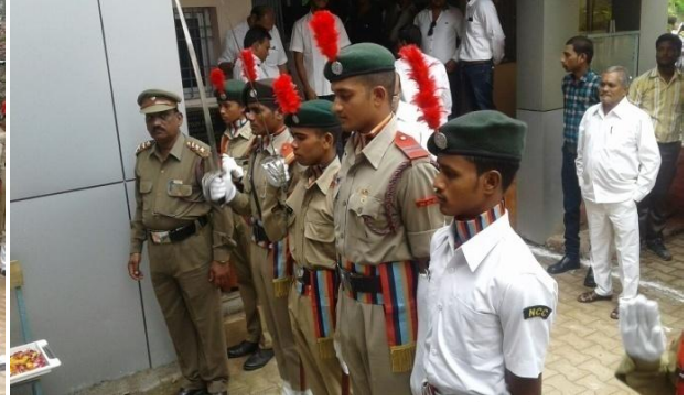
स्वतंत्रता एवं गणतन्त्र दिवस पर महाविद्यालय में सलामी एवं महाविद्यालय के शहीद जवानों को श्रद्धांजली