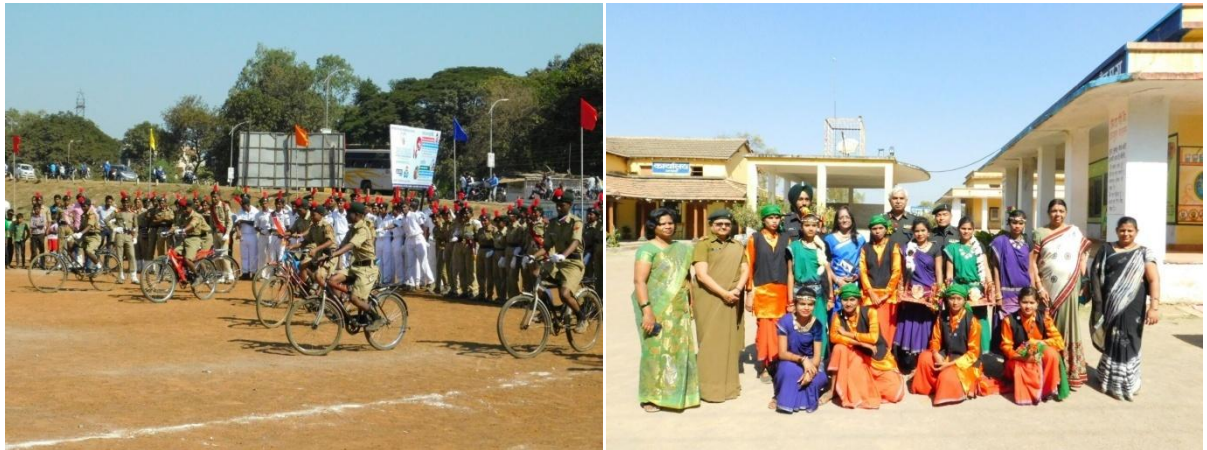
एन.सी.सी. दिवस पर कैडेटों ने खेलकुद एवं सांस्कृतिक कार्यक्रम में भाग लिया