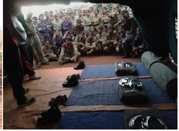
किट ले आउट का अवलोकन