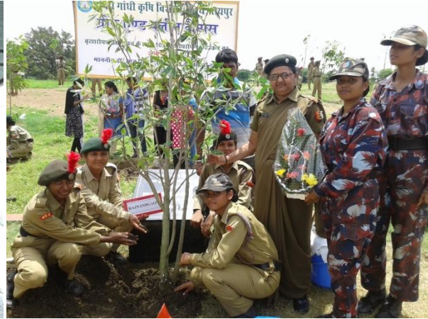
वृक्षारोपण करते कैडेट व अधिकारी