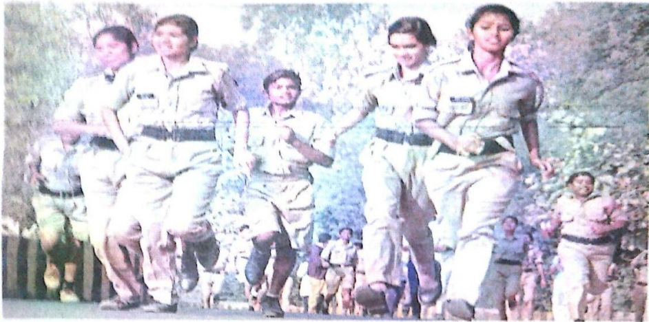
मैराथन गणतंत्र दिवस का महत्वा समझाते हुए एनसीसी कैडेटों के बीच मैराथन दौड़ का आयोजन किया गया। शहर के 155 कैडेटों ने मैराथन दौड़ में हिस्सा लिया। तैयारी वर्षे पुरस्कार भी प्रदान किया गया।