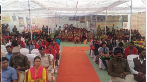
यातायात सुरक्षा सप्ताह में भागीदारी