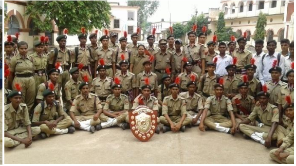
गणतन्त्र दिवस परेड में ड्रील प्रतियोगिता में पुरस्कार प्राप्त कैडेट