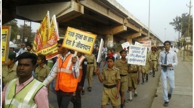
अधिकारियों एवं कैंडेटों की जन-जागरुकता रैली