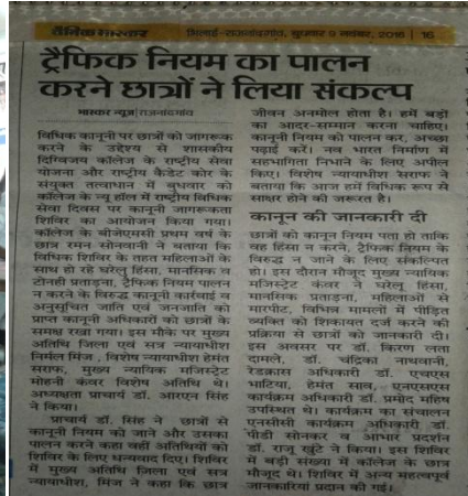
यातायात सुरक्षा सप्ताह में कैंडेटों ने वादविवाद प्रतियोगिता में भाग लिया।