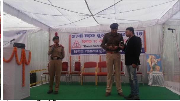
स्लोगन, चित्रकला एवंभाषण प्रतियोगिता