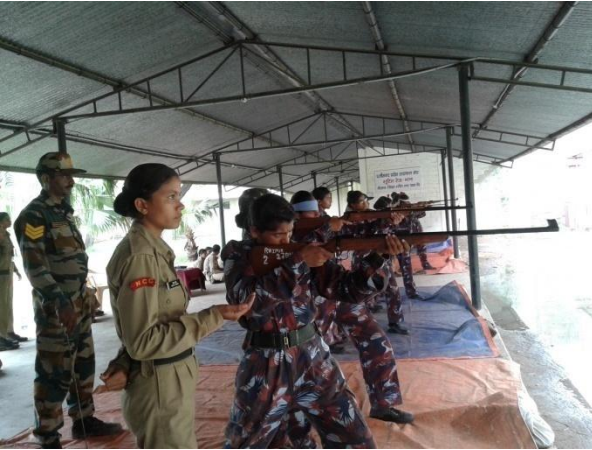
फायरिंग रेंज में निशाना लगाते हुए