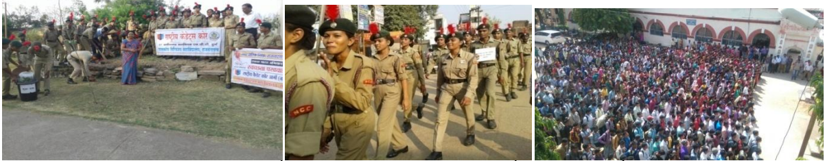
महाविद्यालय में स्वच्छता अभियान एवं नगर में जागरूकता रैली