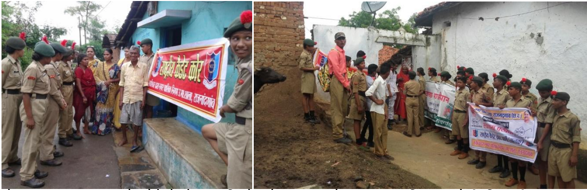
गोद ग्राम आशा नगर में कैडेटों ने रहवासियों को स्वच्छता हेतु जागरूक किया व रैली निकाली