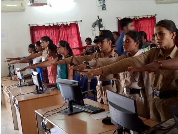
न"ामुक्ति जागरुकता कार्यक्रम : कैडेटों द्वारा भाषण एवंशपथ