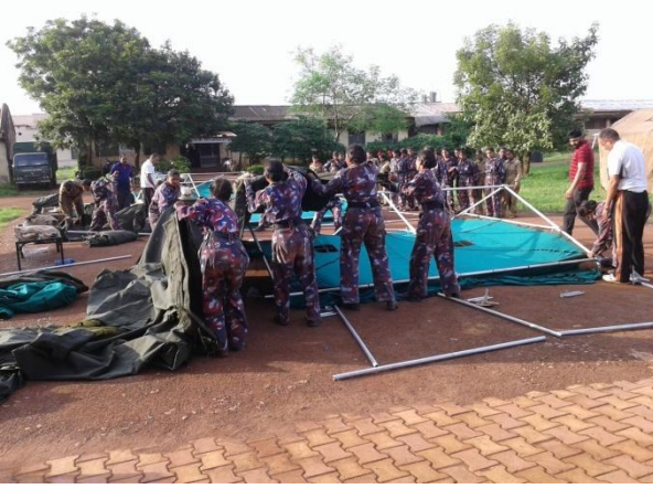
टेन्ट पिचिंग करते कैडेट