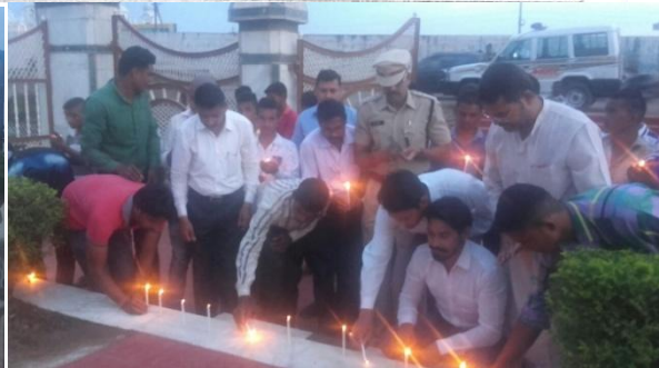
स्वतंत्रता दिवस की पूर्व संध्या पर गौरव-पथ पर श्रधाजली देते हुए कैडेट एवं अधिकारी