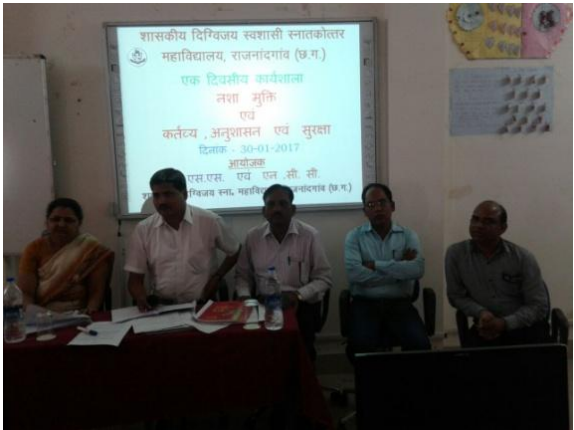
न"ामुक्ति जागरुकता हेतु कैडेटों द्वारा शहर भ्रमण कर रैली निकाली गई। कैडेटों के लिए व्याख्यान का आयोजन किया गया।