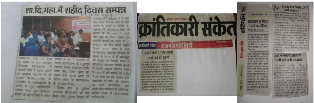
वीर शहीदों की कुर्बानी को याद करते हुए महाविद्यालय में 70 वीं याद करो कुर्बानी पखवाड़ा का आयोजन किया गया।